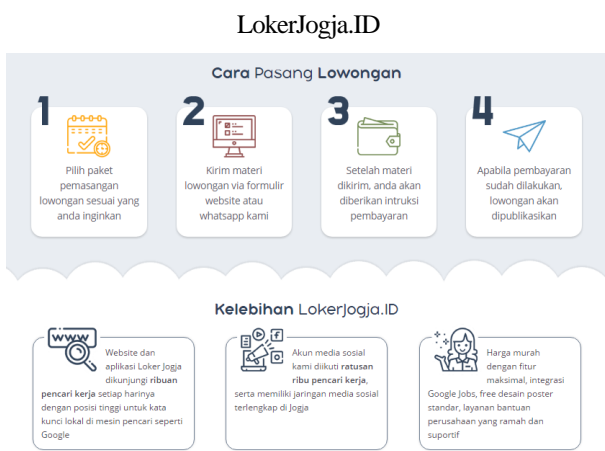
Gambar 3. Tata cara dan kelebihan pasang lowongan di