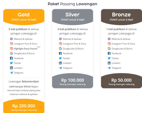
Gambar 2. Paket pasang lowongan di LokerJogja.ID