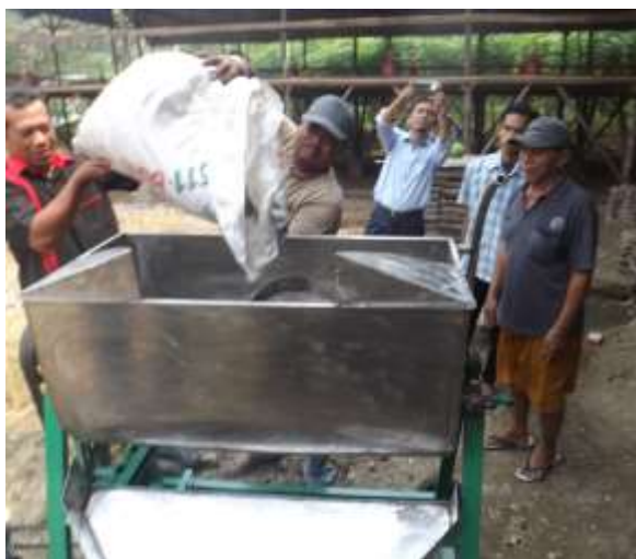
Gambar. Tim pelaksana foto bersama mitra pada proses sosialisasi

pendampingan ini telah dilakukan oleh tim pelaksana bersama sama dengan ketua masing masing kelompok, dengan harapan agar pengetahuan dan ketrampilan yang telah diperoleh oleh masing-masing anggota (kader) dari mitra dapat dikembangkan untuk kepentingan kelompok dan masyarakat sekitarnya. Dalam pelaksanaan pendampingan dan monitoring yang telah dilakukan oleh tim pelaksana muncul beberapa masalah dan kendala dalam proses pembuatan pupuk organik cair. Namun dengan dilakukannya diskusi dan tanya jawab, serta berbagi pengalaman dengan sesama anggota, beberapa masalah dan kendala tersebut dapat teratasi.