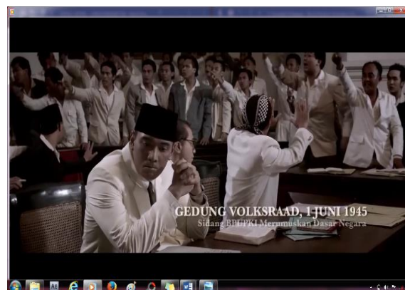
Gambar 3. Film Dokumenter

Pada pertemuan ketiga, pembelajaran pada kelas eksperimen kembali menggunakan media film dokumenter guna memperkuat daya ingat peserta didik, selesai pembelajaran peneliti memberikan soal post-test atau tes akhir. Begitupun dengan kelas kontrol setelah pembelajaran dengan media komik peneliti memberikan post-test atau tes akhir. Dengan hasil rata-rata kelas eksperimen 85,87 sedangkan kelas kontrol 78,50 artinya terdapat perbedaan nilai rata-rata kelas antara kelas eksperimen dan kelas kontrol sebesar 7,37.