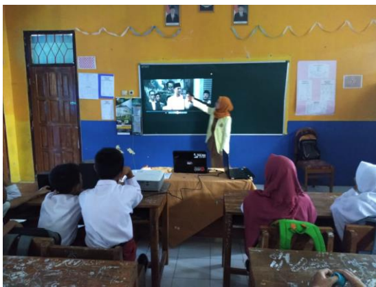
Gambar 2. Penayangan Film Dokumenter

Penelitian dilakukan selama tiga pertemuan. Pertemuan pertama pada kelas VA peneliti melakukan pembelajaran tanpa menggunakan media pembelajaran dan pada akhir pembelajaran peneliti memberikan soal pre-test untuk mengetahui kemampuan awal kognitif peserta didik. Dari hasil pre-test untuk kelas VA memperoleh nilai rata-rata 56,25 sedangkan kelas VB nilai rata-ratanya sebesar 54,57 sehingga peneliti memilih kelas VB sebagai kelas eksperimen yang akan diberi perlakuan menggunakan media pembelajaran film dokumenter dan kelas VA sebagai kelas kontrol meskipun keduanya tidak terdapat perbedaan yang signifikan namun kelas VA lebih unggul. Selanjutnya pada pertemuan kedua di kelas eksperimen dilakukan pembelajaran dengan menggunakan media film dokumenter, untuk mengetahui pemahaman peserta didik peneliti melakukan tanya jawab. Sedangkan pada kelas kontrol pembelajarannya menggunakan media komik.