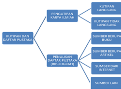
Gambar 3 Peta Konsep tiap bab