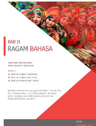
Gambar 2 Tampilan Awal tiap bab