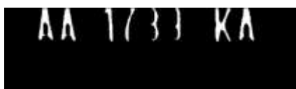
Gambar 6. Plat Nomor yang Tidak Mampu Dibaca Secara Sempurna oleh JST-BP

JST-BP dengan pixel asli maupun pixel terpilih tidak dapat mengenali plat nomor kendaraan yang memiliki kerusakan cukup parah seperti pada gambar 6.