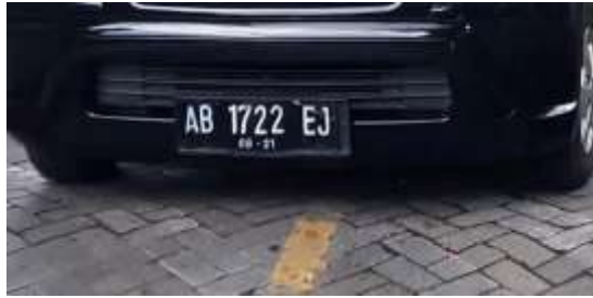
Gambar 2. Citra Mobil Hasil Kamera

Deteksi lokasi platn nomor kendaraan menggunakan histogram approach pada sumbu x ( Horizontal Edge Projection ) dan y ( Vertical Edge Projection ) . lokasi plat nomor kendaraan adalah daerah pada histogram yang memiliki puncak tertinggi pada sumbu x dan sumbu y.