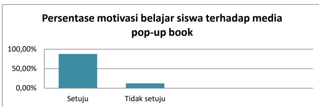
Gambar 4. Grafik Motivasi Belajar Siswa

Peneliti juga memberikan angket kepada siswa untuk mengetahui bagaimana motivasi belajar siswa dengan menggunakan media pop-up book pada subtema ketampakan rupa bumi. Hasil evaluasi media pop-up book untuk motivasi belajar siswa terangkum pada Grafik berikut: