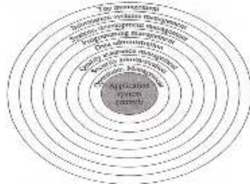
Gambar 1: Control Over IS functions; Ron Weber, 1998

semua sumber daya manusia di lini organisasi menggunakan komputer sebagai media untuk mengakses data.