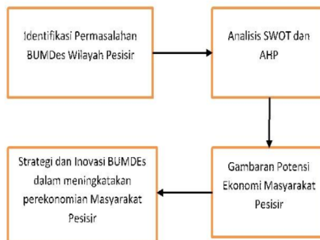
Gambar 1. Road Map Penelitian

Berikut Road map Penelitian yang akan dilakukan dalam rangka mewujudkan BUMDes yang mandiri, produktif, memiliki keunggulan bersaing serta mampu memaksimalkan potensi di wilayah pesisir kabupaten Seluma, dengan mengembangkan BUMDes yang inovatif, sehingga kesejahteraan secara ekonomi masyarakat.