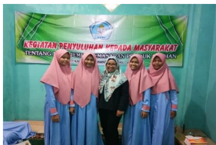
Gambar. 2. Siswi pondok yang terpilih menjadi tim terbaik

Pada gambar 1 , para peserta tengah mengikuti sosialisasi strategi pemasaran produk olahan pisang kepok, di kampung sawah Tangerang Selatan. Adapun materi yang disampaikan meliputi, Jenis pemasaran door to door , Pemasaran secara online, target pasar yang tepat , program discount , dan motivasi pemasaran yang handal.