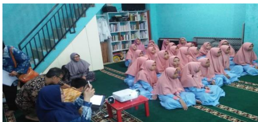
Gambar .1 .Kegiatan penyuluhan

Bagian Para peserta mengikuti program penyuluhan dengan baik, serius dan seksama. Para dosen memberikan tahapan pelaksanaan sesuai dengan metode pelaksanaan yang sudah direncanakan, sehingga dapat berjalan dengan baik.