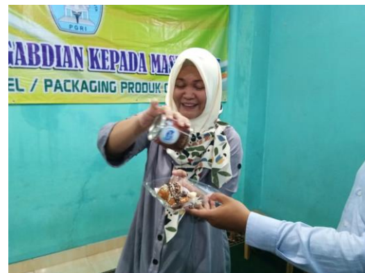
Gambar. 3. Tim memberikan contoh penyajian dan packaging produk.

Pada kegiatan praktek mereka dibagi menjadi 5 kelompok , masing – masing memilih teknik pemasaran yang sudah diberikan seperti diatas , dan hasil yang dicapai rata –rata sudah baik. Penggunaan sosial media ,berperan penting dalam keberhasilan pemasaran, penawaran produk gratis diwilayah mereka juga cukup penting, begitu pula dengan insentif rekomendasi dan hubungan baik kepada pelanggan.