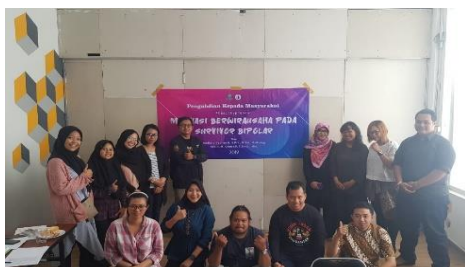
Gambar 3. Peserta dan Pemateri Pelatihan Motivasi Berwirausaha pada Komunitas Bipolar Care Indonesia

Secara keseluruhan pelatihan motivasi berwirausaha dapat dikatakan sesuai dengan yang diharapkan. Selain indikator diatas, keberhasilan juga dapat dilihat dari antusiasme peserta yang berkomitmen mengikuti acara dari awal hingga akhir sesi.