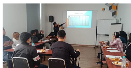
Gambar 2. Pemateri Kedua Menyampaikan Inovasi Berwirausaha

Hasil dari pengabdian masyarakat berupa pelatihan berwirausaha pada survivor bipolar adalah sebagai berikut :