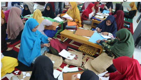
Gambar 2. Proses desain dan pembuatan patch

Selanjutnya adalah kegiatan mendesain dan membuat patch dari kain flanel dengan fokus pada bentuk dan warna. Tema desain bebas, bisa berupa ornamen tradisional, bentuk geometris, flora dan lain sebagainya. Proses desain cukup memakan waktu karena mereka antusias berdiskusi mencari desain favorit masing-masing.