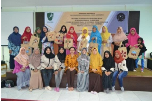
Gambar 4. Sebagian peserta dan hasil karyanya

Diharapkan peserta dapat berkarya dengan tingkat yang lebih tinggi lagi dan menjadikannya sebagai peluang berbisnis di kemudian hari.