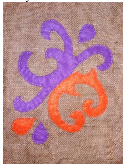
Gambar 3. Salah satu karya ornamen patch

Acara ditutup dengan evaluasi kegiatan oleh peserta. Peserta sangat mengapresiasi kegiatan ini dan berharap akan diadakan kegiatan lanjutan dari Prodi Arsitektur.