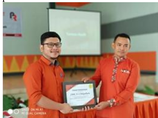
Gambar 4.5 Penyerahan Piagam Penghargaan kepada Wakil Humas Sekolah SMK N 4 Pekanbaru

penghargaan bagi sekolah SMK N 4 Pekanbaru sebagai bentuk apresiasi atas partisipasinya untuk mewujudkan pelatihan ini.