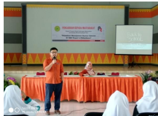
Gambar 4.1 Pemaparan Materi Mengenai Manajemen Humas Sekolah

Pelatihan Manajemen Kehumasan Sekolah yang diadakan oleh Program Studi Hubungan Masyarakat ini dihadiri oleh 24 peserta yang bersal dari perwakilan setiap jurusan sekolah, guru-guru, serta staf humas SMK N 4 Pekanbaru.