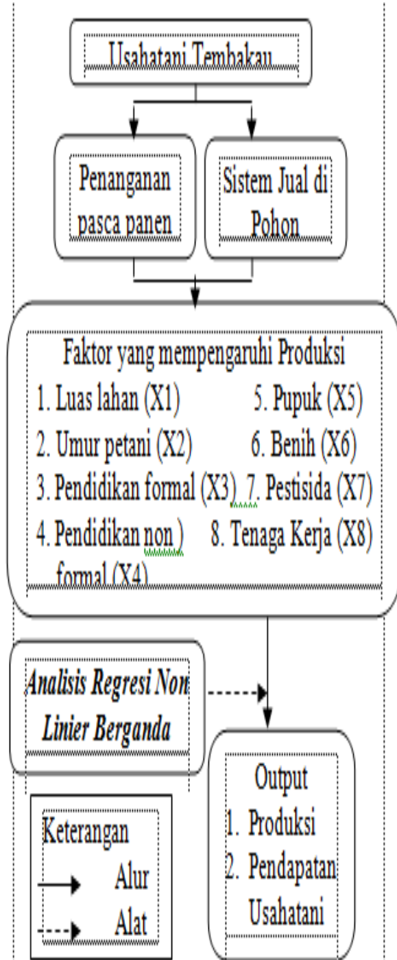
Gambar 1. Alur Penelitian

Alur penelitian sebagaimana pada Gambar 1.