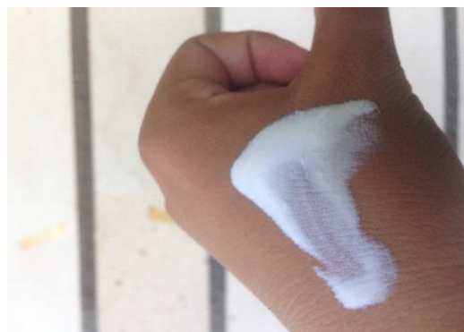
Gambar 2. Sediaan krim bersifat homogen

sediaan krim dari semua perlakuan bersifat homogen, tidak ada butiran-butiran kasar pada krim yang terbentuk. Hasil ini sesuai dengan persyaratan sediaan krim yaitu homogen, tidak terlihatnya dan tidak terasanya butira-butiran kasar (Lubis, 2012). Sediaan krim yang homogen mengidentifikasi bahwa bahan-bahan yang digunakan pada proses pembuatan krim tercampur dengan sangat sempurna. Tidak meratanya sediaan krim dapat berakibat fatal jika sampai digunakan, karena akan dapat melukai permukaan kulit saat dioleskannya krim pada kulit. Sediaan krim yang bersifat homogen dapat dilihat pada Gambar 2.