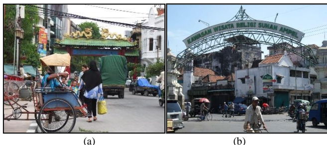
Gambar 4. Beberapa Daya Tarik Wisata Budaya di Kota Surabaya, Kawasan Pecinan (a) dan Kawasan Ampel (b)