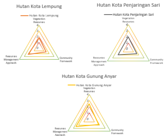
Gambar 3. Radar Chart Hutan Kota Kategori Berkelanjutan Sedang Sumber : Hasil Analisis, 2018

Sedangkan pada hutan kota berkelanjutan sedang memiliki karakteristik dengan nilai yang rendah pada sumberdaya vegetasi (tutupan kanopi, diversitas vegetasi), komunitas (kerjasama industri hijau, kerjasama dinas, keterlibatan pemilik lahan), dan pengelolaan (anggaran,kebijakan, fasilitas, tenaga kerja, upaya daur ulang).