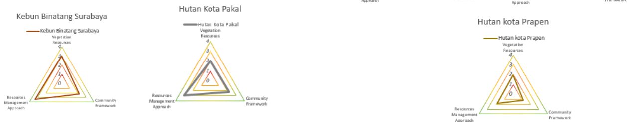
Gambar 3. Radar Chart Hutan Kota Kategori Berkelanjutan Rendah

Pada berkelanjutan rendah memiliki nilai rendah pada setiap faktor baik itu vegetasi, komunitas dan pengelolaan.