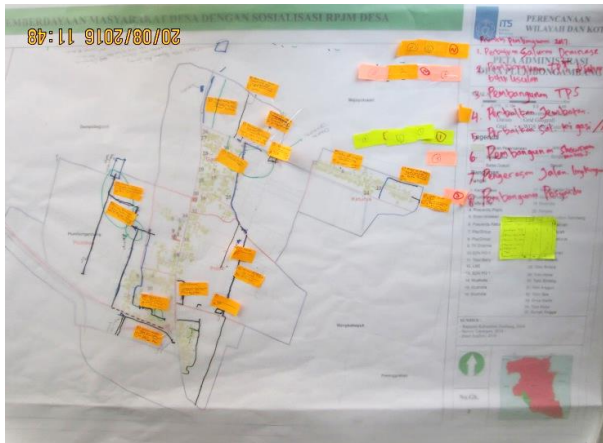
Gambar 1. Hasil Participatory Mapping Aspek Fisik

Dengan menentukan potensi dan masalah yang ada di Dusun Plumbon Gambang, maka masyarakat dapat dengan mudah menyusun alternative program-program pembangunan yang dapat dilaksanakan untuk percepatan pembangunan desa. Adapun program-program pembangunan yang diusulkan masyarakat berdasarkan hasil FGD dapat dilihat pada Tabel 1 .