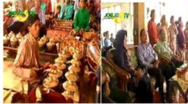
Gambar 13. 1. Iringan gamelan mengiringi acara serah terima. 2. Para pejabat tamu undangan. 3. Presenter program wawancara dengan Wakil Bupati Gunung Kidul.

Setelah acara serah terima di lakukan kemudian di luar halaman balai desa Wonosari diadakan acara menyebar udik-udik (sesajian dan uang logam) yang dilakukan oleh Kepala Desa. Selanjutnya diadakan acara rebutan Gunung setelah terlebih dahulu di doakan. Semua warga saling berebut mengambil hasil bumi sebagai tanda memperoleh berkah dari yang maha kuasa agar selalu diberikan rezeki yang melimpah dengan selalu mengucap rasa syukur kepada Allah S.W.T.