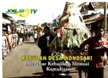
Gambar 7. Gunungan dengan hasil bumi. 2. Hasil bumi Waluh.