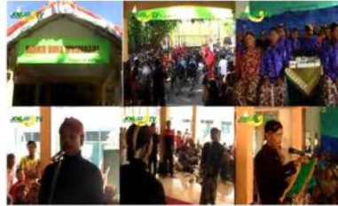
Gambar 12. 1. Balai kelurahan desa Wonosari tempat acar inti Rosulan. 2. Rombongan arak-arakan tiba di depan balai kelurahan. 3. Para tamu undangan yang hadir di balai kelurahan. 4. Sambutan dari wakil pihak rombongan arak-arakan. 5. Suasana serah terima rombongan arak-arakan. 6. Kepala Desa Wonosari menerima rombongan arak-arakan.

Setelah melewati jarak tempuh sejauh dua kilo meter, para peserta acara Rosulan di desa Wonosari ini pun mulai memasuki kawasan di depan kantor kelurahan Wonosari. Setibanya di kelurahan Wonosari arak-arakan tadi diterima oleh kepala desa Wonosari dengan sebuah acara kidmat serah terima layaknya sebuah acara pernikahan.