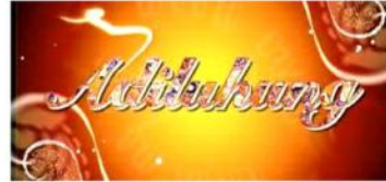
Gambar 2. Opening program & title frame dalam sebuah episode program Adhiluhung

budaya yang dimiliki masyarakat Jogja dan Jawa pada umumnya.