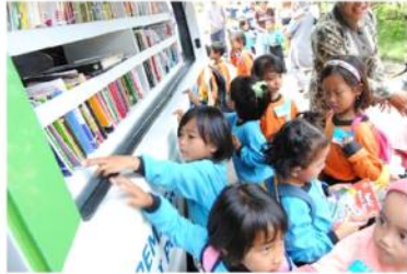
Gambar 15. Kegiatan perpustakaan keliling JOGJA TV

2. Memberikan kesempatan kepada institusi dari manapun untuk melakukan kunjungan ke JOGJA TV guna membina kerja sama-kerja sama di berbagai bidang ke depannya.