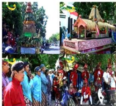
Gambar 8.: 1.Gunungan lengkap beserta hasil-hasil bumi. 2.Gunungan lainnya. 3. Peserta acara lengkap dengan pakaian Jawa. 4. Masyarakat berbaur dengan peserta acara.

Berikutnya penggambaran shot-shot yang lebih jelas mengenai berbagai sesaji bawaan ada gunungan dan ada yang bentuk lain dan keramaian serta antusias para peserta acara dengan kostum budaya Jawa dan warga masyarakat yang menonton acara ini, seperti pada gambar berikut :