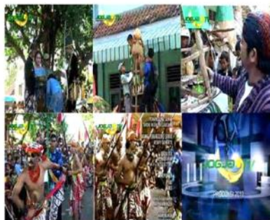
Gambar 14. 1. Kepala Desa menyebar udik-udik. 2. Rebutan hasil bumi yang ada di Gunung. 3. Presenter program juga ikut merebut hasil bumi di Gunung. 4. Sendratari rakyat. 5. Sendratari & colssing title. 6. Produksi program JOGJA TV 2010.

Setelah acara serah terima di lakukan kemudian di luar halaman balai desa Wonosari diadakan acara menyebar udik-udik (sesajian dan uang logam) yang dilakukan oleh Kepala Desa. Selanjutnya diadakan acara rebutan Gunung setelah terlebih dahulu di doakan. Semua warga saling berebut mengambil hasil bumi sebagai tanda memperoleh berkah dari yang maha kuasa agar selalu diberikan rezeki yang melimpah dengan selalu mengucap rasa syukur kepada Allah S.W.T.