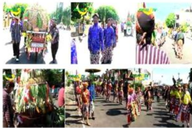
Gambar 11. 1. Pasukan kirab berangkat dengan seperangkat gunungan. 2. Peserta upacara masih belum merasa capek. 3. Presenter terlihat dibelakang rombongan peserta. 4. Gunungan yang diarak berisi jagung, kacang panjang dll. 5. Arak-arakan peserta acara dengan pakaian yang bermacam asesoris. 6. Arak-arakan peserta acara.

Setelah melewati jarak tempuh sejauh dua kilo meter, para peserta acara Rosulan di desa Wonosari ini pun mulai memasuki kawasan di depan kantor kelurahan Wonosari. Setibanya di kelurahan Wonosari arak-arakan tadi diterima oleh kepala desa Wonosari dengan sebuah acara kidmat serah terima layaknya sebuah acara pernikahan.