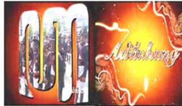
Gambar 6. Opening bumper in program Adiluhung JOGJA TV.

Format dokumenter program Adiluhung bertujuan memberikan informasi kepada khalayak tentang sesuatu yang terjadi pada budaya Jawa atau upacara adat di Daerah Istimewa Yogyakarta dan sekitarnya yang masih eksis sampai saat ini. Tujuan lain program ini juga berfungsi sebagai fungsi dokumentatif dengan harapan program tayangan ini tidak akan pernah dihilangkan dan menjadi bahan dokumentasi bagi setiap daerah atas seni budaya ritual yang diselenggarakan setiap tahun.