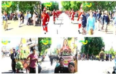
Gambar 10. 1. Upacara kirab diberangkatkan. 2. Paling depan pasukan bergada. 3. Peserta kirab. 4. Gunungan pun diarak presenter ikut serta. 5. Gunungan yang sedang diarak beserta peserta acara. 6. Gunungan melewati alun-alun Wonosari.