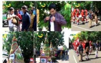
Gambar 9. 1. Presenter program diberi pakai Jawa. 2.Presenter mulai mengenakan pakaian Jawa. 3.Presenter mulai masuk di rombongan peserta acara. 4.Gunungan dari sebuah dukuh. 5.Berbagai gunungan lainnya. 6. Peserta acara mulai disiapkan mulai diberangkatkan.

lengkap dengan pakaian Jawa yang telah ia pakai.