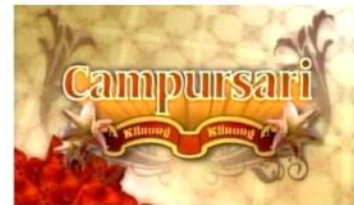
Gambar 3. Opening program & performer frame dalam sebuah episode program Klinong-Klinong Campursari

Konsep Program: Nama Program: Klinong-Klinong Campursari Slot Time : 60 menit Durasi : 60 menit Format : Program Hiburan/musik Segmentasi : Masyarakat umum Deskripsi: Program siaran ini menampilkan berbagai warna dan indahnya kesenian campursari yang diisi oleh group-group campursari yang dari Yogyakarta maupun Jawa Tengah.