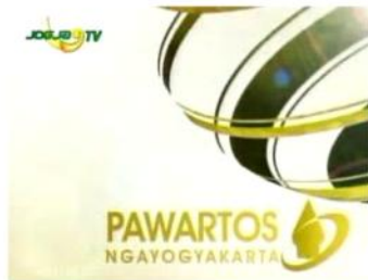
Gambar 4. Opening Program & anchorframe dalam sebuah episode program Pawartos Ngayogyakarta