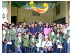
Gambar 16. 1. Kunjungan FMIPA UGM. 2. Kunjungan UPN Surabaya.

2. Memberikan kesempatan kepada institusi dari manapun untuk melakukan kunjungan ke JOGJA TV guna membina kerja sama-kerja sama di berbagai bidang ke depannya.