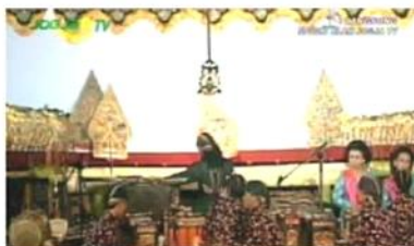
Gambar 5. Opening program & title frame dalam sebuah episode program Wayang