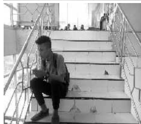
Gambar. 3 ruang Privasi di kampus unisan