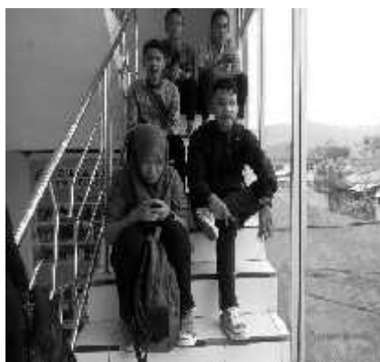
Gambar. 4 ruang Teritorialitas di kampus unisan