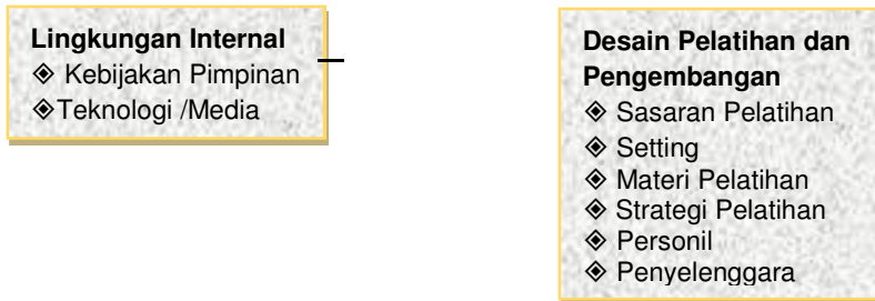
Gambar 1: Hubungan antara Pengembangan dan Pelatihan dengan Manajemen Ketenagaan Guru (Dimodifikasi dari Schuller: 1989).

Perencanaan pengadaan guru merupakan kegiatan mengidentifikasi jumlah dan kualifikasi guru yang dibutuhkan organisasi serta penetapan berbagai kebijakan/program untuk memenuhinya. Rekrutmen dan seleksi merupakan proses untuk mengadakan dan mendapatkan guru dengan kualifikasi sesuai yang dibutuhkan.