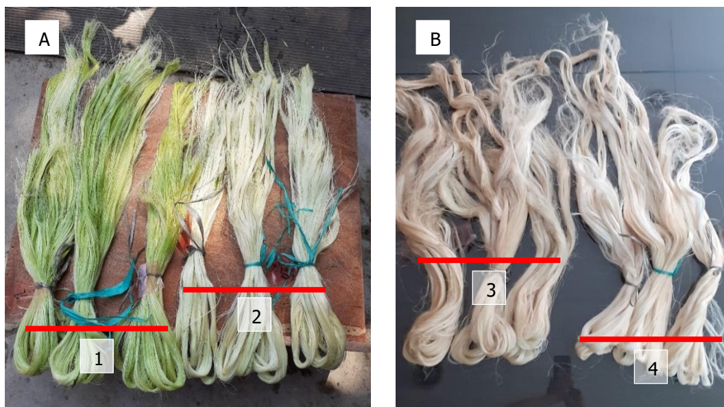
Gambar 2. A. Serat basah : Sistem dekortikasi kering (1), Sistem dekortikasi basah (2) B. Serat kering : Sistem dekortikasi kering (3), Sistem dekortikasi basah (4)

Dekortikasi sistem kering menghasilkan serat basah dengan warna sedikit kehijau-hijauan bila dibandingkan dengan serat yang dihasilkan dengan sistem basah (Gambar 2). Warna kehijau-hijauan yang disebabkan oleh warna hijau daun tersebut terlihat sedikit berpengaruh terhadap kecerahan warna serat setelah dikeringkan. Warna serat hasil sistem basah sedikit lebih cerah dibanding hasil serat sistem kering. Sedikit perbedaan warna tersebut diperkirakan akan berpengaruh jika pemanfaatan serat sisal tersebut untuk benang tekstil. Namun jika digunakan untuk produk industri lainnya, sedikit perbedaan warna tersebut kurang berpengaruh terhadap mutu