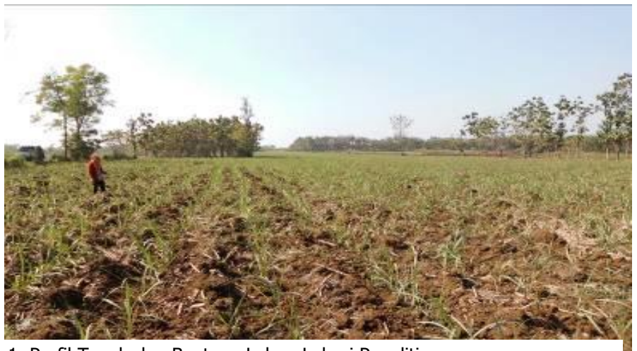
Gambar 1. Profil Tanah dan Bentang Lahan Lokasi Penelitian