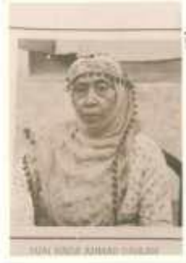
Gambar 1 KH. Ahmad Dahlan dan Siti Walidah

Pembacaan karakter dari Siti Walidah untuk film animasi ini akan dibuat secara deskriptif. Pada pembacaan karakter ini akan dijelaskan seperti pakaian yang dikenakan, ekspresi mata, wajah dan bentuk tubuh, serta tekstur dari pakaian yang digunakan.