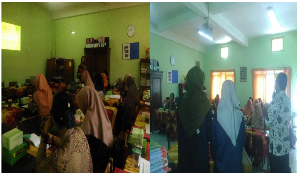
Gambar 2. Pelatihan Penulisan Proposal dan Laporan PTK

Guru yang telah memiliki proposal PTK lengkap melaksanakan PTK di kelas masing – masing dengan pendampingan dari tim pengabdian. Pendampingan dilakukan juga melalui email dan telepon (whats up, sms, telpon). Dalam melaksanakan penelitian tidak ada kendala yang berarti yang dihadapi oleh guru – guru di SD Tamansari I. Saat pengolahan data, tim pengabdian juga memberikan pendampingan kepada guru dalam mengolah data penelitian. Guru sedikit memerlukan bantuan dalam menggunakan komputer untuk mengolah data penelitian.