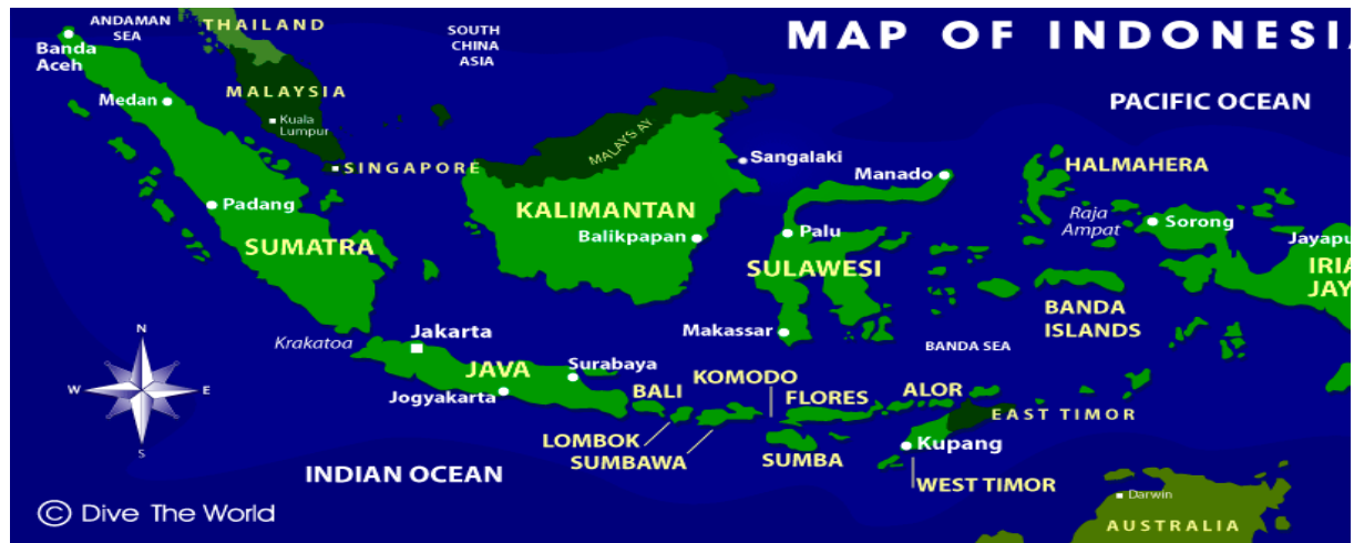
Gambar 2. Peta dari Kepulauan Indonesia