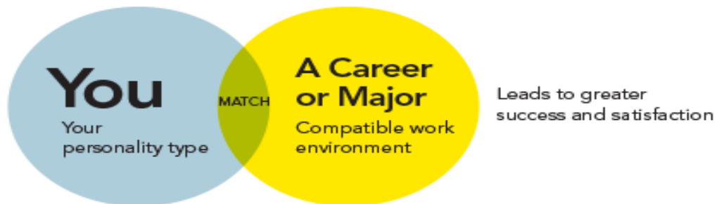
Gambar 1: Match personality