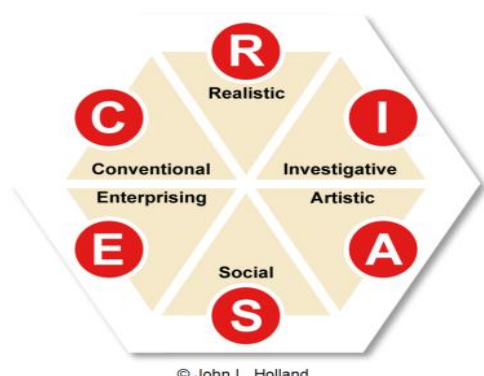
Gambar 1: Holland's Hexagon

sikap dan nilai-nilai mereka, sambil mengambil masalah dan peran yang menyenangkan. Perilaku ditentukan oleh interaksi antara kepribadian dan lingkungan (Hurtado Rúa, Stead, & Poklar, 2019; McKay & Tokar, 2012).