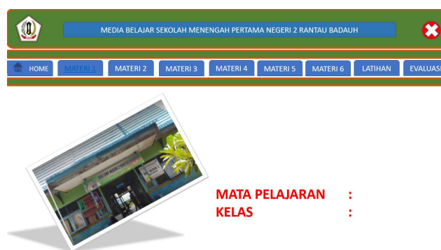
Gambar 1. Contoh Antar Muka Media Pembelajaran

Berikut contoh antar muka media pembelajaran dan soal untuk ujian yang telah dibuat :