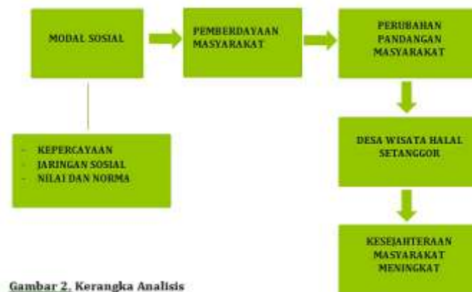
Gambar 2. Kerangka Analisis

Berhasilnya pemberdayaan yang terjadi di Desa Setanggor, menciptakan aktivitas ekonomi baru yang dikemas menjadi Desa Wisata Halal, yang mana keberadaannya dapat berkontribusi dalam meningkatkan kesejahteraan masyarakat. Keberhasilan Desa Setanggor melalui aktor kunci, Ida Wahyuni, melalui sejumlah dinamika. Modal sosial yang ditemukan antara lain: