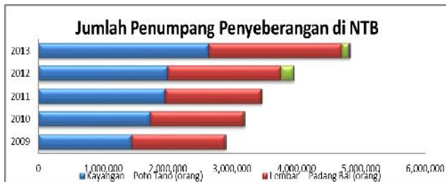
Gambar 1. Jumlah Penumpang Penyeberangan di Nusa Tenggara Barat