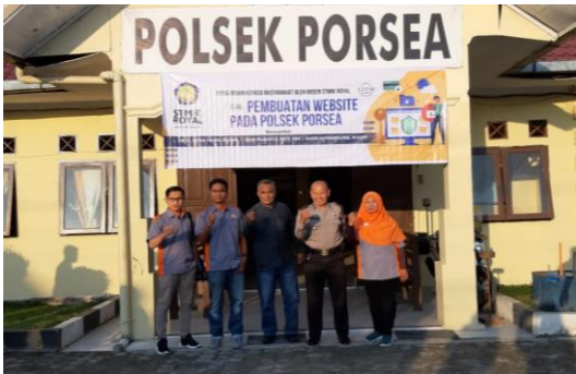
Gambar 4. Sambutan Hangat dari Kapolsek Porsea

yang menggunakan komputer untuk pembuatan surat-surat saja, sekarang staf yang terlibat dapat menggunakan aplikasi komputer dalam proses berita, sistem informasi, berbagi informasi melalui media informasi website.