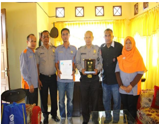
Gambar 6. Penyerahan Sertifikat dari STMIK Royal kepada Polsek Porsea