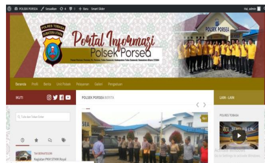
Gambar 3. Tampilan Halaman Website

Berikut adalah tampilan utama website yang akan diakses oleh public yang menyediakan informasi kegiatan polsek, prestasi kinerja, serta pelayanan yang diberikan oleh polsek Porsea