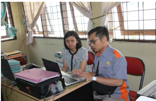
Gambar 5. Kegiatan Pelatihan kepada salah satu Staf IT Polsek Porsea