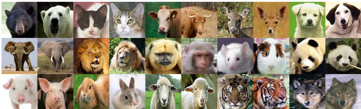
Gambar 1. Citra Wajah Hewan Mamalia Tampak Depan pada dataset LHI-Animal Faces [11]

Pada penelitian ini, dataset yang digunakan adalah LHI-Animal-Faces. Dataset ini merupakan data citra wajah hewan tampak depan yang terdiri dari 19 jenis hewan diantaranya 15 jenis hewan mamalia dan 4 jenis hewan unggas [11]. Sesuai dengan kebutuhan penelitian ini maka diambil 15 jenis hewan mamalia yang tiap jenisnya terdiri dari 60 citra dengan ukuran 150 \times 150 pixel . Citra hewan mamalia tampak depan pada dataset dapat dilihat pada Gambar 1.