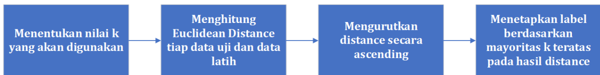
Gambar 5. Tahapan Metode k-NN [13]