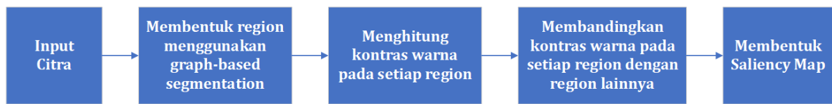
Gambar 3. Tahapan Metode Global Contrast Saliency [10]