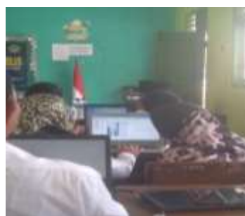
Gambar 2. Suasana Pelatihan

Kegiatan pelatihan metodologi penelitian dan penggunaan software Statistika SPSS bertujuan untuk meningkatkan pemahaman guru tentang metodologi penelitian dan penggunaan SPSS dalam analisis data penelitian, sehingga diharapkan dapat mendorong produktivitas dan kualitas penelitian yang dilakukan oleh guru Yayasan Miftahul Ulum Timbuan. Gambar 2 menunjukkan suasana pada saat kegiatan pelatihan berlangsung.