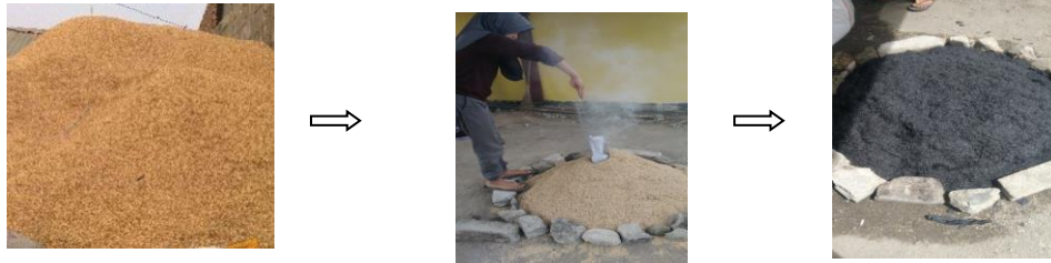
Gambar 1 alur pembuatan biochar metode gasifikasi