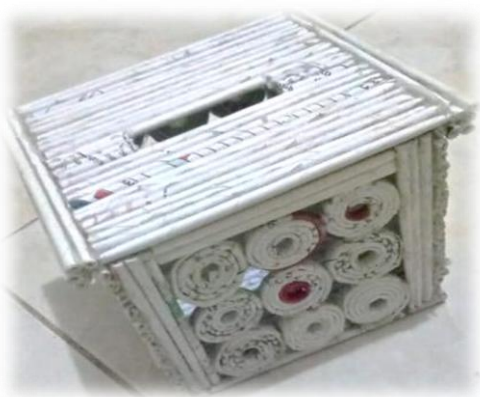
Gambar 11. Produk kerajinan tangan

kelompok 36 pada kecamatan Cikeusal dan kelompok 70 pada kecamatan Ciomas berupa kotak tisu dengan ukuran kecil. Untuk memberikan kesan warna yang lebih menarik dapat dilakukan dengan menambahkan proses pemberian vernis dan pengecatan. Produk kerajinan tangan pada kegiatan ini dapat dilihat pada Gambar 11.