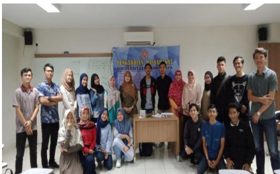
Gambar 7. Peserta kegiatan knowledge sharing

Pada praktek pembuatan kerajinan tangan ini diawali dengan proses pengguntingan limbah kertas menjadi 2 bagian selanjutnya terlihat pada Gambar 8. Kemudian dilanjutkan dengan proses penggulungan limbah kertas yang dilem pada bagian ujungnya terlihat pada Gambar 9 dan hasil gulungan limbah kertas dapat dilihat pada Gambar 10. Untuk membuat satu bagian dari kerajinan tangan dilakukan perakitan pada gulungan-gulungan kertas yang sebelumnya di ukur terlebih dahulu. Kemudian rakit dengan menggunakan lem tembak.