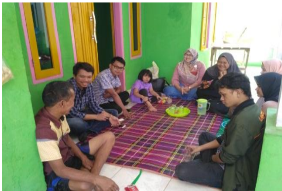
Gambar 4. Observasi Awal Silaturahmi Ketua RW

memperoleh informasi dalam tercapainya tujuan akhir pengabdian. Selanjutnya merumuskan masalah dan solusi yang dihadapi oleh masyarakat dalam kaitannya dengan kewirausahaan. Silaturahmi kepada perangkat desa dapat dilihat pada Gambar 4 dan Gambar 5.