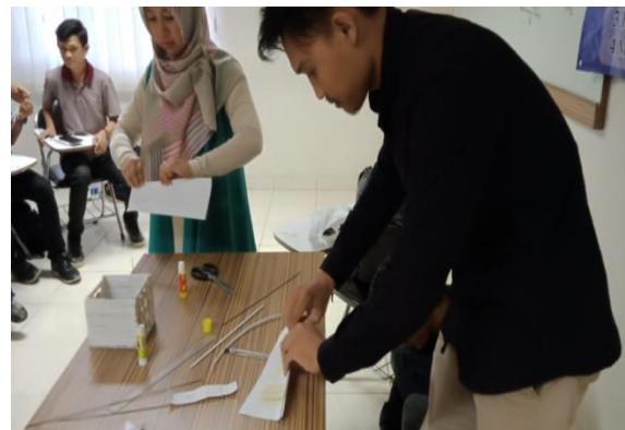
Gambar 9. Proses penggulungan limbah kertas