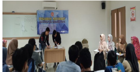
Gambar 8. Proses pengguntingan limbah kertas