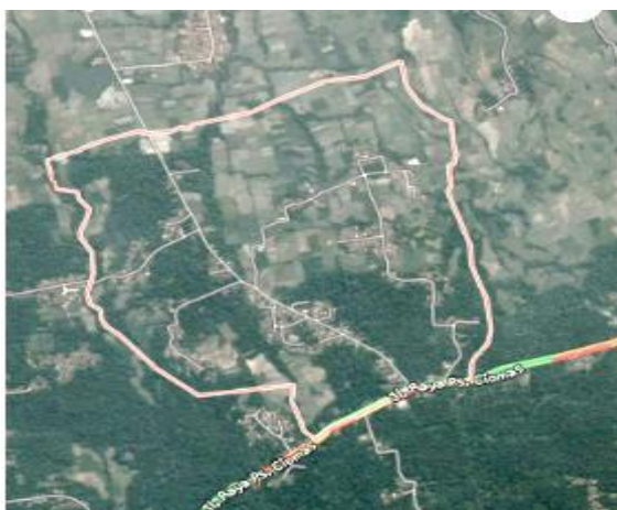
Gambar 3. Peta Desa Pondok Kahuru – Ciomas

melalui situs http://desapondokkahuru.blogspot.com , jumlah penduduk desa Pondok Kahuru terdiri atas 2.264 jiwa Laki-Laki dan 2.009 jiwa perempuan. Berdasarkan tingkat pendidikan 53% dari seluruh total penduduk adalah tamatan Sekolah Dasar (SD). Selain pelajar dan tidak bekerja, mata pencaharian penduduk didominasi oleh buruh harian dan buruh tani.