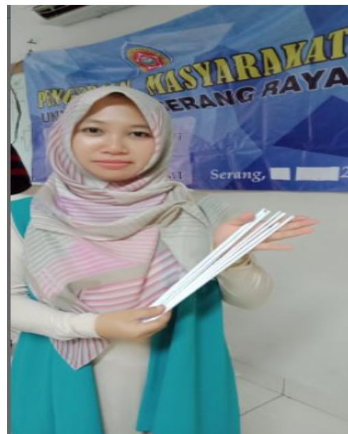
Gambar 10. Hasil Gulungan limbah kertas