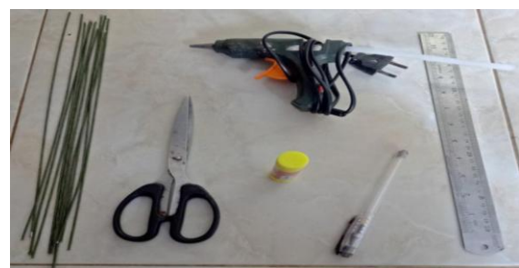
Gambar 6. Bahan yang digunakan

Pada tahap ini dilakukan kegiatan persiapan bahan diantaranya menyiapkan bahan berupa kertas bekas pakai, kawat panjang untuk menggulung kertas, lem fox untuk menempelkan bagian kertas, lem tembak untuk menempelkan gulungan satu dengan lainnya, pulpen untuk membentuk gulungan kertas, pengaris dan gunting untuk memotong. Bahan-bahan disiapkan oleh dosen pembimbing lapangan dibantu oleh mahasiswa. Kegiatan persiapan bahan dilaksanakan pada tanggal 20 Juli 2019. Adapun bahan-bahan yang akan digunakan dalam pembuatan kerajinan tangan dapat dilihat pada Gambar 6.