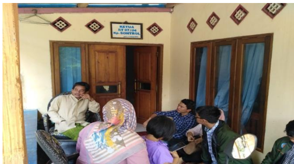
Gambar 5. Observasi awal silaturahmi ketua RT

Meninjau lokasi kegiatan dilaksanakan pada 16 Juli 2019 oleh peserta KKM kelompok 26 dan kelompok 36 di Kecamatan Cikeusal dan kelompok 70 dikecamatan Ciomas didampingi oleh 1 orang Dosen pembimbing lapangan di tiap kelompok. Selanjutnya peserta KKM menentukan waktu pelaksanaan