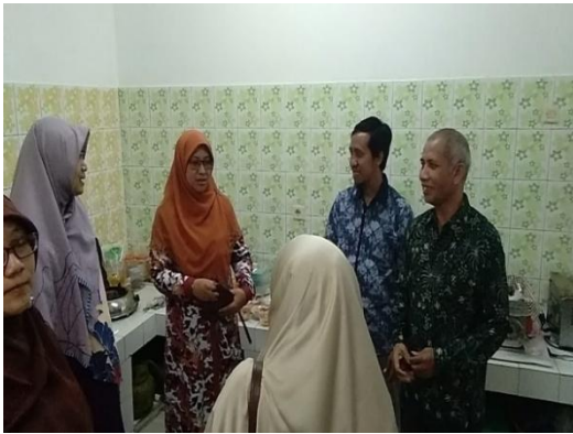
Gambar 8. Kunjungan ke ruang usaha