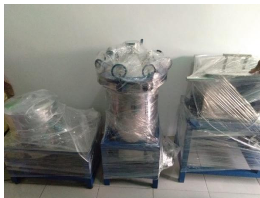
Gambar 5. Peralatan yang diserah terimakan