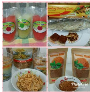
Gambar 1. Beberapa Produk Olahan Makanan Bunda Juminah Food

Bunda Juminah Food merupakan salah satu jenis usaha mikro kecil dan menengah (UMKM) yang bergerak di bidang makanan dan minuman. Perusahaan yang didirikan oleh Bunda Juminah pada tahun 2013 ini menghasilkan berbagai macam jenis makanan, terutama olahan dari ikan bandeng seperti bandeng isi tanpa duri dan abon bandeng, serta produk makanan lain seperti bawang goreng, kering kacang teri, dan kolang-kaling.