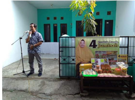
Gambar 7. Sambutan Ketua Tim Pengusul