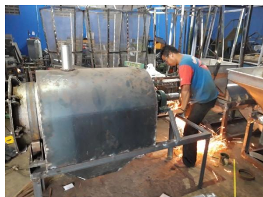
Gambar 3. Proses pembuatan alat di bengkel rekayasa