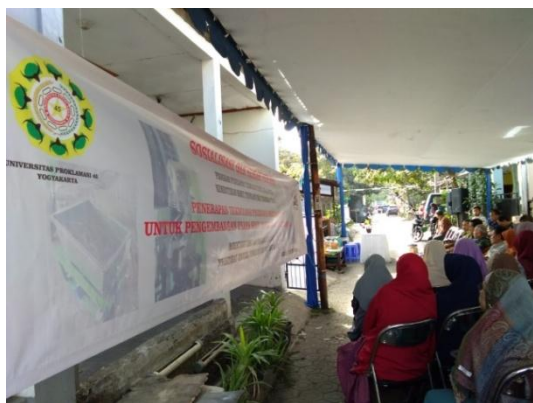
Gambar 4. Acara Serah Terima alat

Kegiatan utama dari program penerapan teknologi tepat guna (PPTTG) ini adalah serah terima alat dan pelatihan. Acara dilakukan pada Tanggal 7 September 2019 di halaman rumah Bunda Juminah, sebagai penerima mesin-mesin tersebut. Dalam kesempatan ini, acara serah terima juga dihadiri anggota Komisi X DPR RI, perwakilan dari pemerintah Kota Bandung, kedua mitra serta warga masyarakat penerima bantuan mesin tersebut. Setelah acara serah terima, dilanjutkan dengan pelatihan pengoperasian peralatan untuk operator mesin-mesin tersebut, termasuk pelatihan peningkatan produktifitas UKM oleh narasumber yang kompeten di bidangnya. Menurut penelitian yang dilakukan[9], pelatihan yang diadakan sendiri tidak berdampak pelatihan secara parsial berpengaruh signifikan terhadap keberdayaan pengrajin batik, sedangkan penggunaan teknologi tepat guna secara parsial berpengaruh tidak signifikan terhadap keberdayaan pengrajin batik. Pelatihan dan teknologi tepat guna secara bersama-sama berpengaruh signifikan terhadap keberdayaan pengrajin batik artinya tingkat keberdayaan pengrajin batik ditentukan oleh pelatihan dan penggunaan teknologi tepat guna. Hal ini telah sejalan dengan proses yang dilakukan dalam program ini.