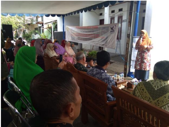
Gambar 6. Sambutan Anggota Kom X DPR RI