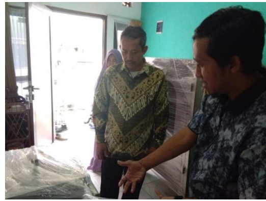
Gambar 9. Penjelasan prosedur kerja peralatan