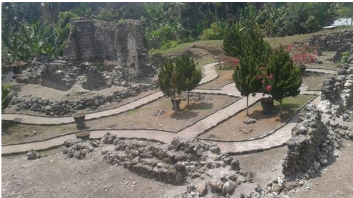
Gambar 4 Eksisting Benteng Nostra Senora Del Rosario/Benteng Kastela