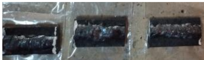
Gambar 9. Hasil pemotongan Spesimen

Setelah selesai di las kemudian spesimen tersebut didinginkan dengan air. Spesimen tersebut terdiri dari yaitu terdiri dari plat hasil las dengan elektroda E6013, plat hasil las dengan elektroda E6013 yang sudah dilapisi Nikel, plat hasil las elektroda E6013 yang ditambahkan karbon dan plat hasil las dengan elektroda E6013 yang dilapisi Nikel dan ditambahkan karbon. Setelah masing – masing spesimen dipotong dengan gergaji, dengan hasil seperti gambar 9.