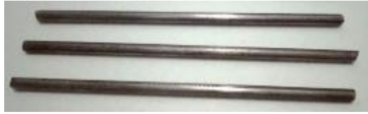
Gambar 1. Elektroda yang sudah di bersihkan