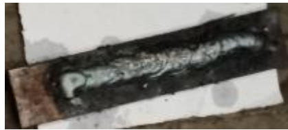
Gambar 8. Hasil pengelasan

Setelah menyiapkan alat dan bahan pengelasan, lalu dilakukan proses pengelasan dengan hasil seperti gambar 8.