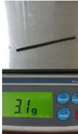
Gambar 2. Pengukuran Berat Elektroda sebelum pelapisan