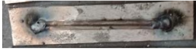
Gambar 5. Persiapan elektroda terlapis Nikel yang akan dilas

Menyiapkan elektroda E6013 diatas baja karbon rendah, kemudian di beri titik di ujung kanan dan kiri elektroda, lalu menambahkan unsur Karbon diatasnya.