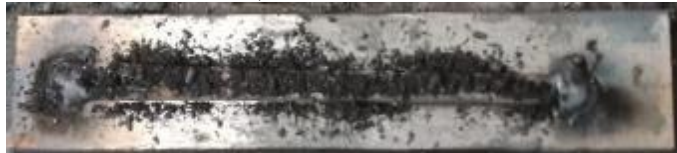
Gambar 7. Persiapan pengelasan dengan penambahan Karbon pada elektroda yang telah dilapisi Nikel

Menyiapkan elektroda E6013 yang telah dilapisi nikel diatas baja karbon rendah, kemudian di beri titik di ujung kanan dan kiri elektroda, lalu menambahkan unsur Karbon diatasnya.