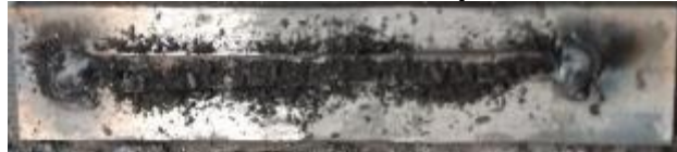
Gambar 6. Persiapan pengelasan dengan penambahan Karbon

Menyiapkan elektroda E6013 diatas baja karbon rendah, kemudian di beri titik di ujung kanan dan kiri elektroda, lalu menambahkan unsur Karbon diatasnya.