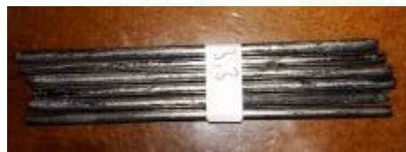
Gambar 4. Hasil pelapisan Elektroda dengan Nikel