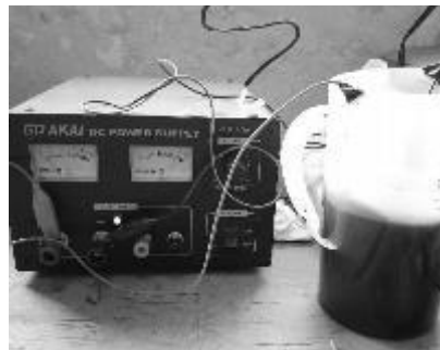
Gambar 3. Proses pelapisan elektroda dengan Nikel