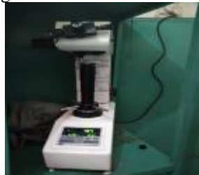
Gambar 11. Proses Uji Kekerasan Vickers