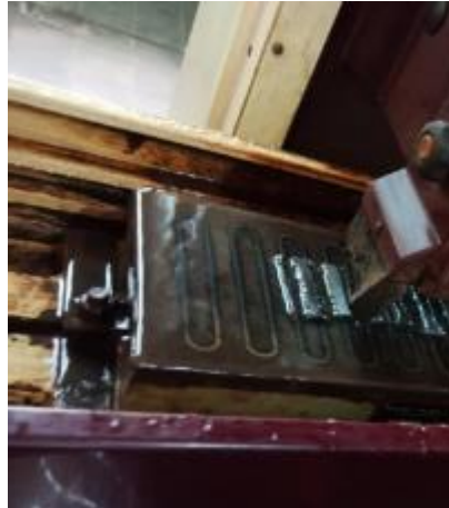
Gambar 10. Proses Meratakan Permukaan