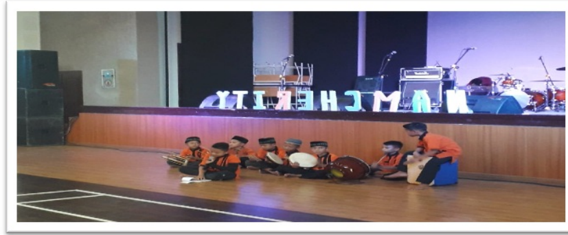
Gambar 3. Santri Tampil Hadrah di Salah satu Event