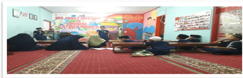
Gambar 2. Siswa Latihan muhadharah (Dakwah)

Kegiatan pengembangan diri merupakan upaya untuk membentuk watak, karakter dan kepribadian siswa yang dilakukan melalui beberapa kegiatan ekstrakurikuler. Hal ini adalah cita-cita dari sebuah pendidikan yang sesungguhnya yaitu terbentuknya manusia yang kreatif, cerdas dan memiliki keluhuran budi (Pransiska, 2018). Diantara kegiatan pengembangan diri tersebut yaitu olahraga, latihan hadrah , latihan dakwah ( muhadharah ), dan kegiatan lainnya. Para siswa biasanya dilatih dan dibina untuk menyalurkan bakat dan minat yang dimilikinya dalam kegiatan-kegiatan tersebut. Dalam latihan dakwah misalnya, mereka dibiasakan berbicara di depan publik ( public speaking ) atau khalayak dalam rangka untuk mengasah keberanian mereka dalam mengutarakan dan menyampaikan pesan dakwah serta membangun kepercayaan diri ( self confident building ). Mereka diajarkan bagaimana menyusun materi dakwah yang baik dan rektorika penyampaiannya sesuai dengan kondisi masyarakatnya (Heri, Interview, Januari 2019).