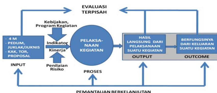
Gambar 2. Pemantauan Pengendalian Intern

Sistem pengendalian intern yang efektif dibutuhkan demi terwujudnya tata kelola yang baik ( Good Governance ). Keberhasilan implementasi good governance sendiri tergantung bagaimana instansi pemerintah sebagai sebuah organisasi mematuhi beberapa prinsip antara lain :