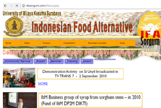
Gambar 5. Komponen News Pada Domain “ifasorgum.com”

Komponen news digunakan untuk memberi informasi mengenai kegiatan yang telah dilakukan oleh Universitas Wijaya Kusuma berkaitan dengan penelitian dan pengembangan yang telah dilakukan terhadap sorgum, seperti ditunjukkan pada gambar 5. Didalam komponen News tersebut ditampilkan informasi mengenai “ Community Service ”, “ Expert ”, “ Seminar ”, “ Training ”, “ Award ”, dan “ Another Link ”.