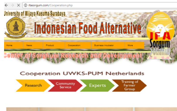
Gambar 7. Komponen Cooperation Pada Domain “ifasorgum.com”

Komponen Cooperation digunakan untuk memberi informasi mengenai kerjasama yang telah dilakukan oleh Universitas Wijaya Kusuma Surabaya, yaitu kerjasama yang telah dilakukan didalam negeri dan kerjasama internasional, seperti ditunjukkan pada gambar 7.