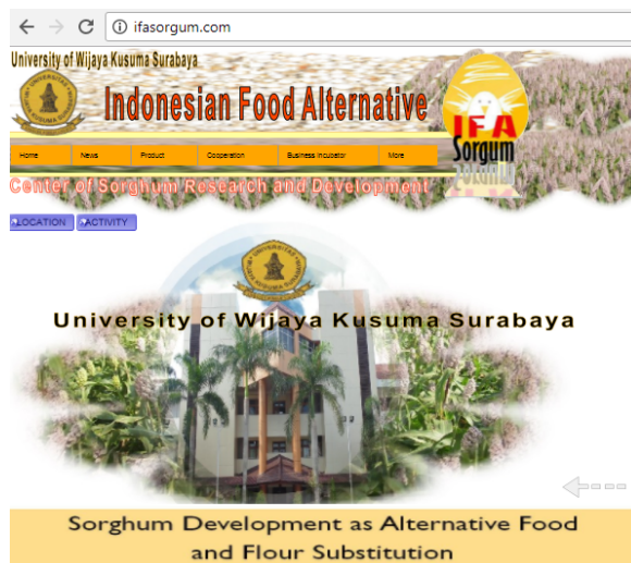
Gambar 4. Tampilan Utama Website “ifasorgum.com”

Hasil penelitian adalah website promosi sorgum dionlinekan di internet agar dapat diakses oleh siapapun, dan kapanpun. Tampilan utama website “ifasorgum.com” seperti ditunjukkan pada gambar 4.