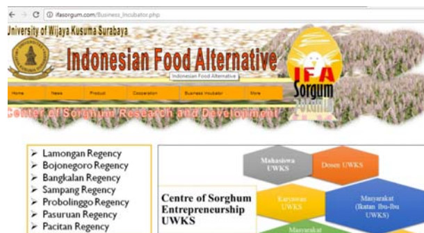
Gambar 8. Komponen Business Incubator Pada Domain “ifasorgum.com”

Komponen Business Incubator digunakan untuk memberi informasi mengenai aktifitas inkubator yang telah dilakukan oleh Universitas Wijaya Kusuma dalam mengembangkan entrepreneurship dalam pengembangan sorgum, seperti ditunjukkan pada gambar 8.