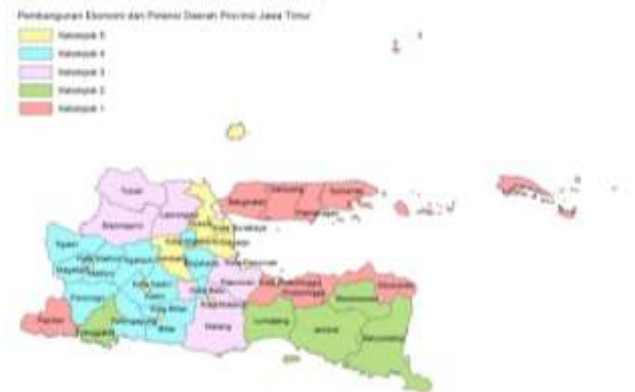
Gambar 1. Pemetaan Pembangunan Ekonomi dan Potensi Daerah Provinsi Jawa Timur

Hasil pengelompokan kabupaten/kota berdasarkan indikator pembangunan ekonomi dan potensi daerah Provinsi Jawa Timur dapat dilihat melalui pemetaan yang terdapat pada Gambar 1.