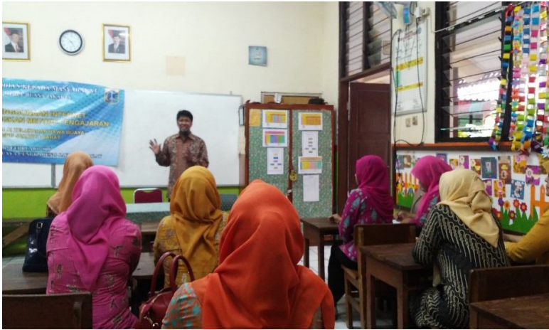
Gambar 4. Foto Penyampaian Materi oleh Tim Pengabdian Masyarakat

Masalah waktu menjadi masalah yang sangat krusial dalam pelaksanaan pelatihan yang dilakukan di sekolah. Kesibukan para guru dalam kegiatan pembelajaran sesuai jadwal sekolah adalah hal utama yang harus dilakukan oleh para guru. Persiapan yang dilakukan sebelum kegiatan pelatihan merupakan faktor penentu keberhasilan acara pelatihan ini. Para peserta dalam kegiatan pelatihan mengajukan pertanyaan yang sangat bagus seperti terlihat dari pertanyaan para peserta. Selain masalah waktu, keterbatasan tempat dan tidak adanya laboratorium komputer disekolah merupakan faktor yang memperlambat proses pelatihan.