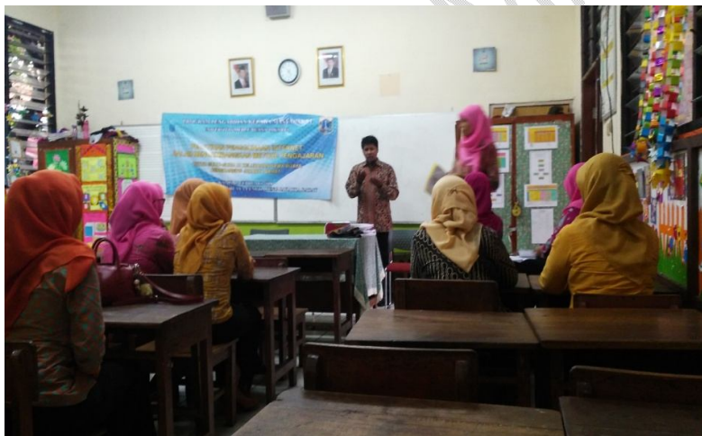
Gambar 3. Seorang peserta menyampaikan permasalahan internet disekolah

Pada pelaksanaan kegiatan pelatihan terlihat antusiasme para peserta dalam mengikuti paparan materi pelatihan oleh tim pengabdian masyarakat dan dalam pelaksanaan praktek internet yaitu browsing dan download materi pembelajaran. Tim peneliti melakukan foto bersama dengan peserta pelatihan dari SDN 05 Petang Rawa Buaya sebelum kegiatan dimulai. Terlihat para peserta bersemangat untuk mengikuti pelatihan penggunaan internet untuk pengembangan metode pengajaran.