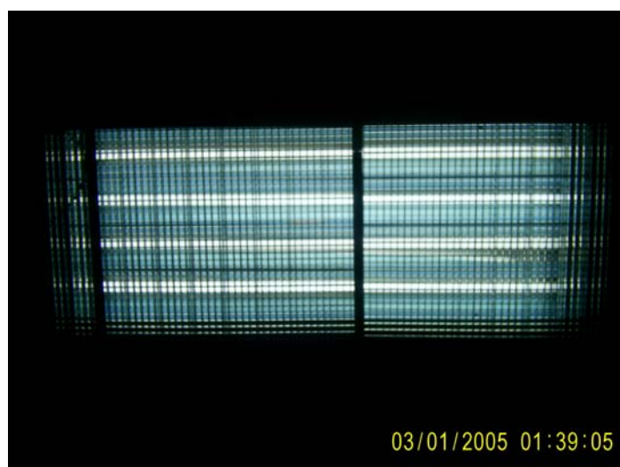
Gambar 3. Sumber cahaya pada ruang kendali utama untai uji termohidrolika reaktor

Lampu penerangan yang digunakan lampu tabung fluoresen adalah lampu dengan tabung busur api lurus yang bagian dalamnya dilapisi bubuk fluoresen yang mengandung muatan uap merkuri bertekanan rendah. Konstruksi lampu fluoresen dapat dilihat pada gambar di bawah ini. Sumber cahaya yang digunakan terdiri dari 4 buah lampu fluoresen (TL) yang disusun dalam suatu armatur dan reflektor plastik sehingga menghasilkan penerangan langsung dengan cahaya menyebar. Penggunaan armatur dan reflektor mengakibatkan efisiensi kuat penerangan sebesar 65% [2] .