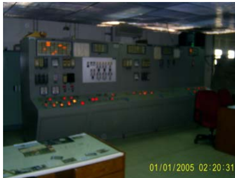
Gambar 1. Kondisi di Ruang Kendali Utama PTRKN-BATAN