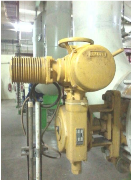
Gambar 1. Katup sistem pendingin sekunder PA-01 AA003

katup dengan penggerak mekanik dilakukan pengujian buka-tutup katup. Sedangkan perawatan katup yang menggunakan penggerak elektromekanik selain pengujian buka-tutup, juga dilakukan pengaturan torsinya. Pengaturan torsi dilakukan berdasarkan jumlah laju alir, diameter pipa, penurunan tekanan dan jenis katup.