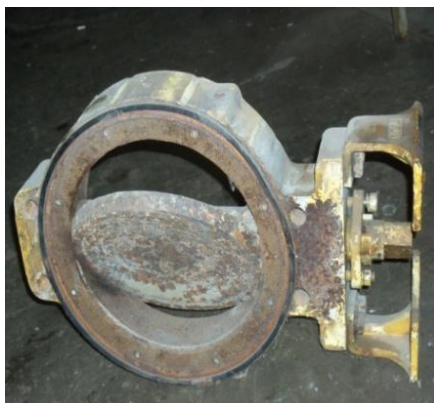
Gambar 2. Jenis katup butterfly yang digunakan di RSG-GAS