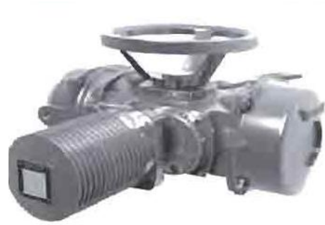
Multi-turn Actuator SA 3 - SA 100 Auma Norm