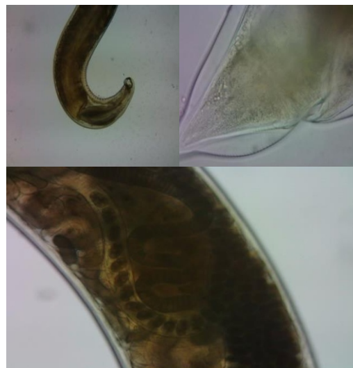
Gambar 3. Morfologi khas Necator americanus

Keterangan: Tanda Panah menunjukkan adanya tukak multipel gastroduodenal dan infestasi cacing di duodenum dengan ukuran 0,5-1 cm