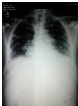
Gambar 1. Hasil foto polos dada (13 juli 2013)

Hasil laboratorium awal didapatkan Hb 1,70 g/dL, MCV 63,2 fL MCH 14,9 pg, penurunan serum iron, leukosit 8,05 \times 10^3/\mu\text{L} , eosinofilia 2,2%. Foto rontgent dada menunjukkan infiltrat pada paracardia kanan dan kiri (Gambar 1).