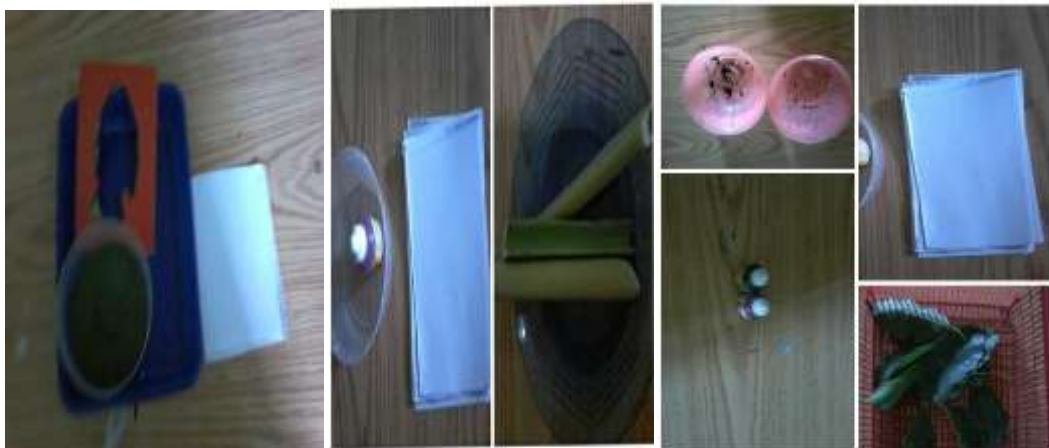
Gambar 4.1 media bahan alam yang digunakan sebagai media pembelajaran

Guru mengatur ruang kelas terlebih dahulu agar dalam proses pembelajaran anak merasa aman, nyaman, senang, dan tidak bosan ketika proses pembelajaran berlangsung. Guru mengatur lingkungan kelas satu hari sebelum pembelajaran dilakukan. Setelah anak-anak pulang, guru merapikan kelas untuk kegiatan pembelajaran esok hari. Karena pada minggu pertama dan kedua masuk sekolah aktivitas belajar belum teratur, maka anak belajar di kelas masing-masing tidak berpindah sentra. Setiap hari guru melakukan kegiatan yang sama setelah anak-anak pulang sekolah kecuali menentukan tema dan tujuan.