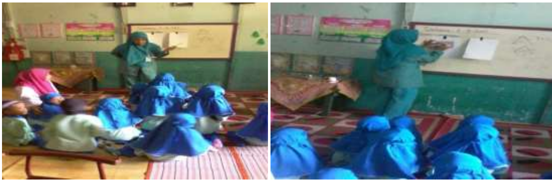
Gambar 4.2 guru menjelaskan materi pembelajaran dan memberikan contoh mengerjakan tugas

Pelaksanaan kegiatan pembelajaran menggunakan media bahan alam untuk mengembangkan motorik halus anak dari hasil observasi, yakni pada awalnya dimulai dengan penjelasan guru tentang apa yang akan dipelajari, memberi tahu kepada anak-anak bahan apa yang akan digunakan untuk belajar pada hari ini dan guru mencontohkan bagaimana mengerjakan tugas yang akan dikerjakan oleh anak-anak. Guru menjelaskan terlebih dahulu tugas yang akan diberikan kepada anak karena kalau langsung diberikan tugas anak-anak tidak mungkin dapat mengerjakannya, karena minggu pertama masuk sekolah guru hanya melakukan pengenalan tentang bahan alam dan anak-anak satu per satu maju ke depan menyebutkan nama bahan alam dan membedakan mana yang kasar dan halus. Sedangkan dari hasil wawancara, pada kegiatan pembelajaran yang diberikan guru dapat mengembangkan motorik halus anak, yaitu meminta anak untuk memegang bahan alam yang ada dan meraba mana yang terasa kasar dan halus ditangan.