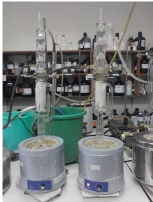
Gambar 3. Proses Ekstraksi Sokletasi Minyak Biji Kelor

77,1°C. Proses sokletasi minyak biji kelor dinyatakan selesai ketika warna pelarut telah berubah kembali seperti keadaan awalnya. Warna pelarut n-heksana yaitu bening transparan. Sedangkan pada saat awal proses ekstraksi warna pelarut yang membawa ekstrak berwarna kuning. Maka dari itu, perlu pengamatan warna pelarut hingga menjadi bening transparan kembali untuk menentukan bahwa proses telah selesai.