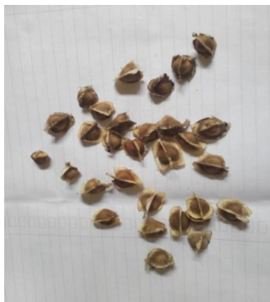
Gambar 1. Biji Kelor sebagai bahan baku

Persiapan bahan baku biji kelor dilakukan proses sortasi dan grading yang bertujuan untuk menyeragamkan bahan baku yang akan digunakan pada penelitian ini. Bahan baku berupa biji kelor didatangkan dari Jawa Tengah, dapat dilihat pada Gambar 1 dibawah ini