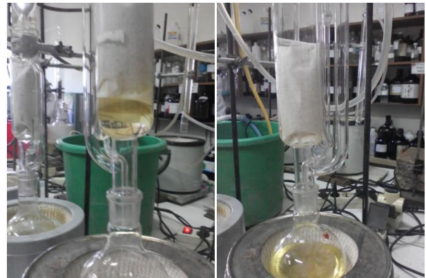
Gambar 5. Warna Pelarut Pada Selongsong Sokletasi. (i) Warna Pelarut Saat Sokletasi Berlangsng; (ii) Warna Pelarut Saat Sokletasi Selesai

77,1°C. Proses sokletasi minyak biji kelor dinyatakan selesai ketika warna pelarut telah berubah kembali seperti keadaan awalnya. Warna pelarut n-heksana yaitu bening transparan. Sedangkan pada saat awal proses ekstraksi warna pelarut yang membawa ekstrak berwarna kuning. Maka dari itu, perlu pengamatan warna pelarut hingga menjadi bening transparan kembali untuk menentukan bahwa proses telah selesai.