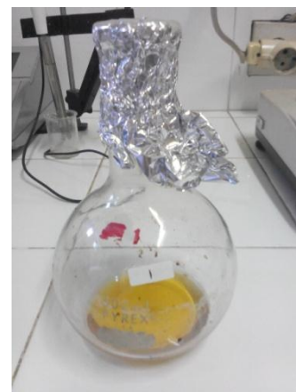
Gambar 6. Ekstrak Minyak Biji Kelor

Pada penelitian ini, pelarut yang digunakan adalah n-heksana, etanol dan metanol. Berdasarkan titik didih n-heksana, maka suhu yang digunakan pada sokletasi harus di atas 69,1°C agar pelarut dapat menguap. Namun, suhu pada sokletasi juga perlu dijaga agar tak melebihi 77,1°C sehingga kandungan flavonoid pada ekstrak tidak rusak. Oleh karena itu, suhu yang digunakan pada ekstraksi biji kelor yaitu pada rentang 69,1°C-