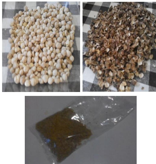
Gambar 2. Proses Sortasi Biji Kelor serta proses pengecilan ukuran menjadi bubuk

memperluas permukaan bahan sehingga akan memudahkan pelarut dalam mengekstrak bahan. Proses sortasi biji kelor dan produk bubuk inti biji dapat dilihat pada Gambar 2. dibawah ini :