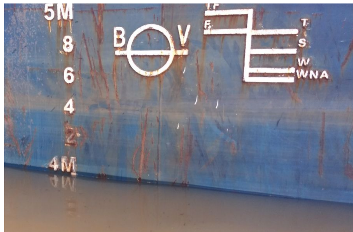
Gambar 5. Plimsoll Mark Tongkang Alnair