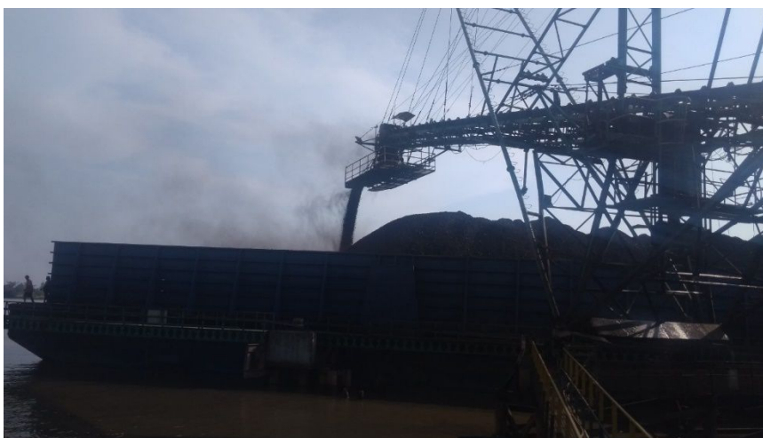
Gambar 1. Proses Pemuatan pada Tongkang Alnair

Objek yang menjadi fokus pada penelitian ini adalah tongkang Alnair. Tongkang ini bersandar di Jetty U Sungai Putting (KPP) Kalimantan Selatan untuk memuat batubara yang nantinya akan dimuat ke kapal MV. MAJORCA. Tongkang ini memiliki ukuran dimensi 320 \times 90 \times 20 Feet.