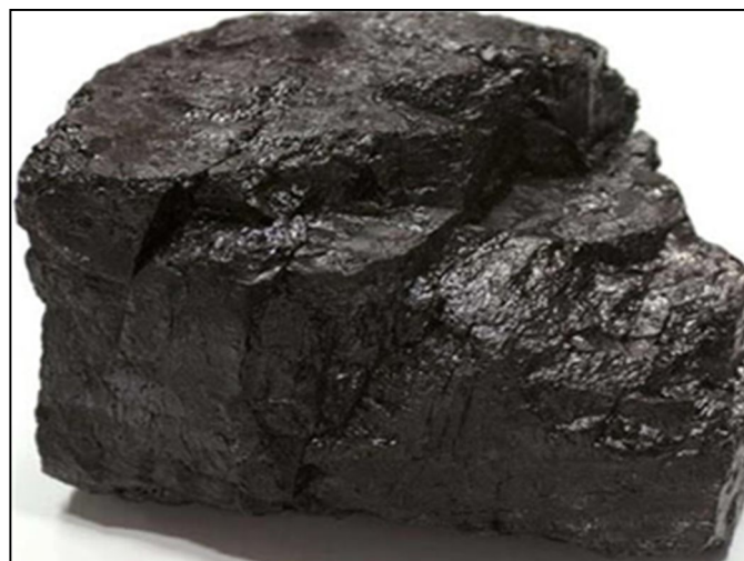
Gambar 3. Batubara Sub-Bituminus

Batubara yang mengandung sedikit karbon dan banyak air dan oleh karenanya menjadi sumber panas yang kurang efisien dibandingkan dengan bituminus. Batubara ini memiliki kandungan air sebesar 23,4 %, karbon sebesar 42,4%, dan kalori sebesar 5403 (Kcal/kg), serta memiliki berat jenis 5 \text{ g/cm}^3 .