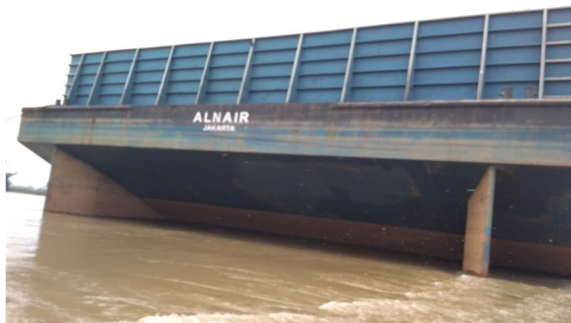
Gambar 2. Tampak Belakang Tongkang Alnair