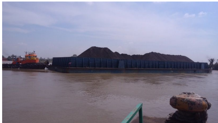
Gambar 6. Tongkang Alnair Setelah Dimuat

Dimana TF untuk Tropical Fresh Water , T untuk Tropical , F untuk Fresh Water , S untuk Summer , W untuk Winter , dan WNA untuk Winter North Atlantic . Adapun Class yang menstandarkan diantaranya adalah AB untuk American Bureau of Shipping , BV untuk Bureau Veritas , VL untuk DNV GL , IR untuk Indian Register of Shipping , LR untuk Lloyd's Register , NK untuk Nippon Kaiji Kyokai dan RI untuk Registro Italiano Navale (Anonymous, 2019).