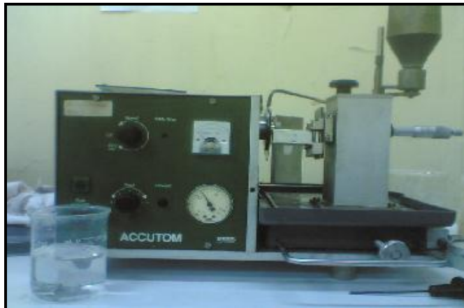
Gambar-1. Alat Potong ACCUTOM Tampak Bagian Depan (Lokasi HR-22)

dimaksudkan agar kegiatan dekontaminasi yang dilakukan tidak menimbulkan kerugian terhadap materi maupun pekerja.