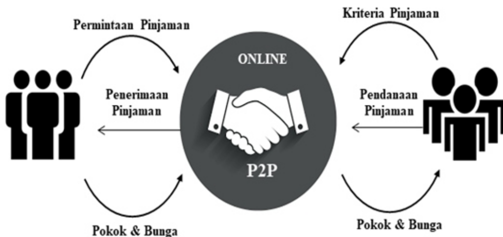
Gambar 1. Proses Transaksi P2P Lending (Sree, 2016)

Sistem P2P lending merupakan pola interaksi keuangan dalam FinTech antara pihak penyedia dana ( lender ) dan pihak peminjam dana ( borrower ) yang transaksinya dilakukan secara online. FinTech sistem P2P Lending, bukan hanya sekedar memfasilitasi mereka yang membutuhkan pinjaman dana, tetapi juga diperuntukan bagi investor yang ingin menanamkan modalnya dalam jumlah tertentu. Sehingga perusahaan FinTech